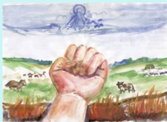
П.А. Ойуунуский «Великий Куданса»